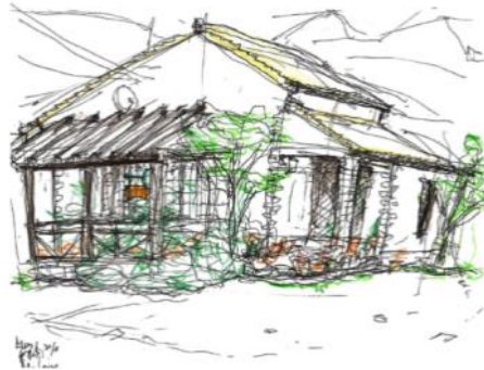
コーヒーハウス ラバン いそのまこと

街かどなど、観光ガイドで紹介されている鳥取とは違う一面に触れました。しばらく住んでみれば分かる、この街の良さを共感して頂けるようであれば、幸いです。